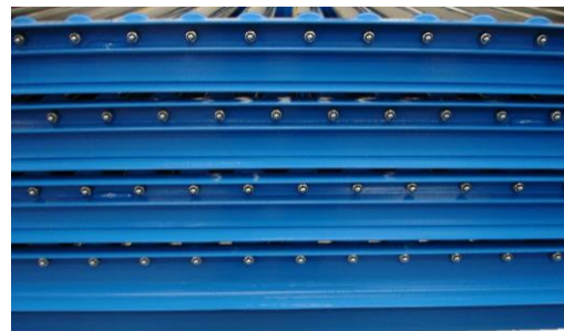
Heavy duty roller section