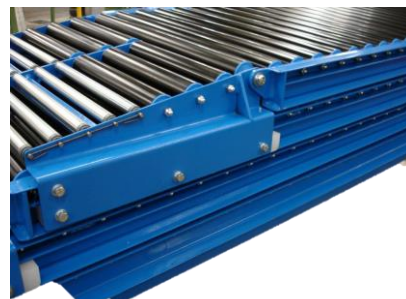
Heavy duty transfer