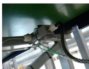
Kablar, utrustade med dragavlastning