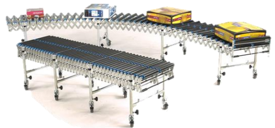
PVC rullar utförda i mycket slitstark PVC